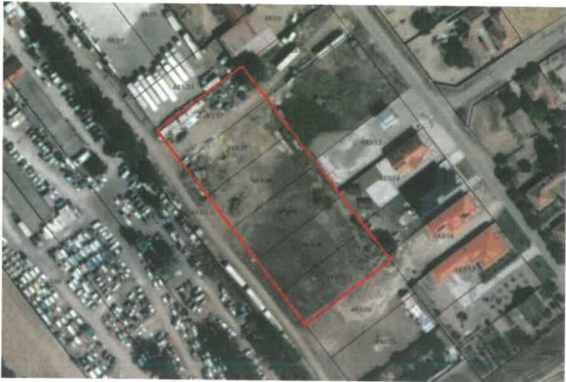
Szabályozási terv részlet