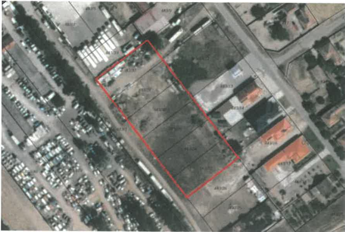
Szabályozási terv részlet