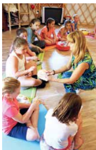
„És még igaz is volt rám!” Egy véletlenszerű önismereti tréning: a jurtában mindenki húzott egy kis cédulát, rajta kérdéssel