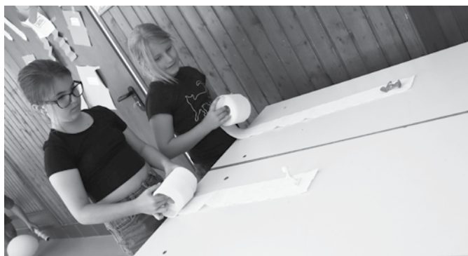
A WC-papíron álló kiskatonát minél gyorsabban fel kell tekerni