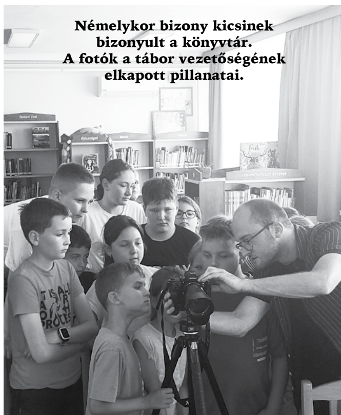
Némelykor bizony kicsinek bizonyult a könyvtár. A fotók a tábor vezetőségének elkapott pillanatait.