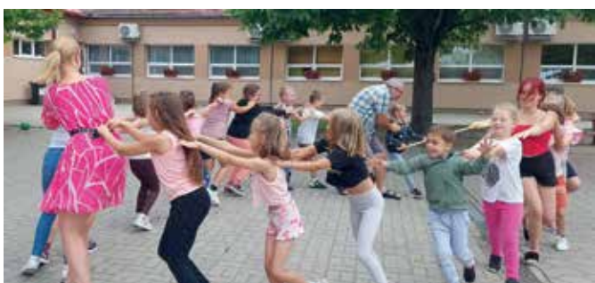
Egy abbaahagyhatatlan játék: amikor a kígyó feje a saját farkát üti söprével