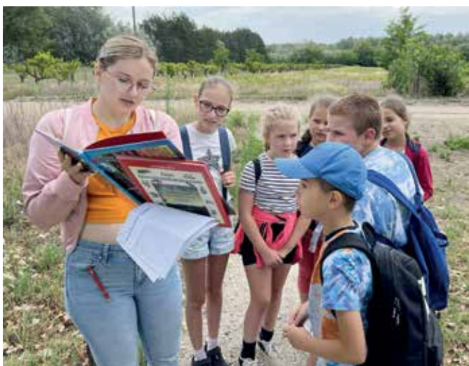
Növények meghatározása könyvvel — nem árt tudni, mi mire jó...