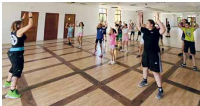
Zumbáztunk, merthogy mozogni is kellett