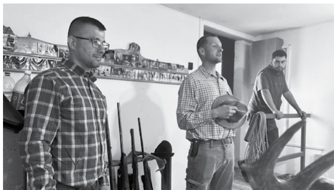
Marcona urak meleg szeretettel: a téma a vadászat és a vadgazdálkodás rejtelmek

Következzék egy kis képriport! A fotók a résztvevőknek köszönhetőek.