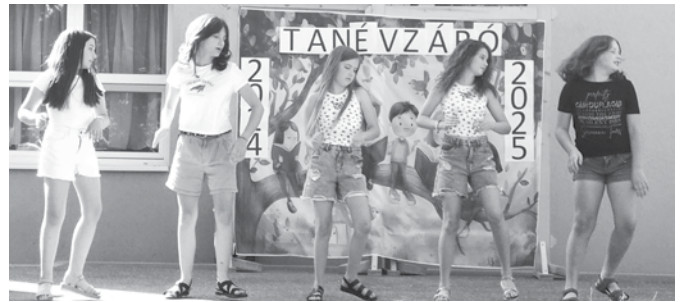
Részlet a 4. osztályosok műsorából