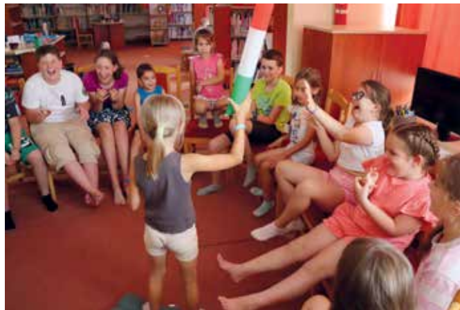
Aki nem tudott rögtön mondani egy állatnevet, fejbe verték. Ezért a játékról sorállás volt!