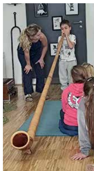
Egy kis zene-csoda Kecskeméten