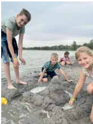
Bár fúj a szél, és majdnem esett is, azoknak a homokváraknak el kellett készülniük a tóparton. Jövőre talán vízibiciklizünk is...