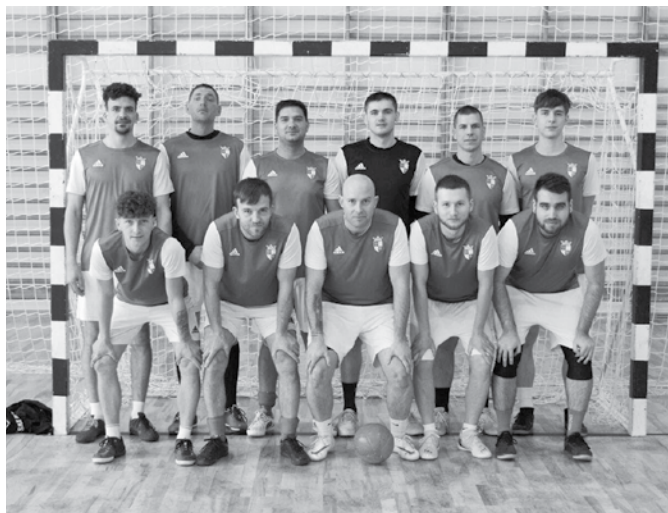
A bócsa csapat Soltvadkertben

Több hetes teremtorán vett részt a csapatunk a télen Kis-kunhalason, melyen 18 csapat indult. Bravúros játékkal sikerült a fiúknak a bajnoki cím a B ligában!