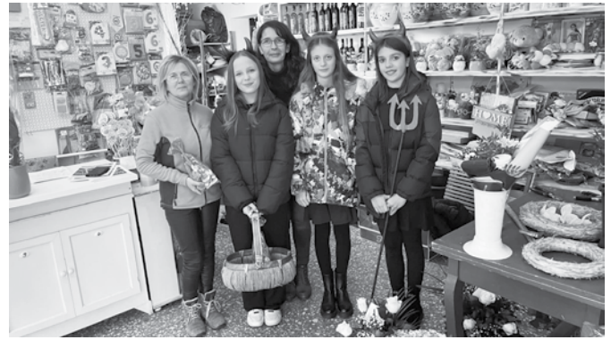
Hagyományos Mikulás- és krampuszjárás december elején a helyi vállalkozóknál és intézményekben.

és Kollégium által rendezett angol versenyen csapatunk 3. helyezést ért el.