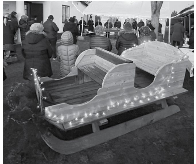
Kivilágított szán a Tájház udvarán adventkor

Érdemes azért elmenni a bócsai Tájházba, melynek udvarán megtekinthető egy szépen felújított szán.