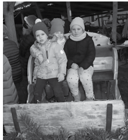
A gyerekeknek így is nagy öröm felülni