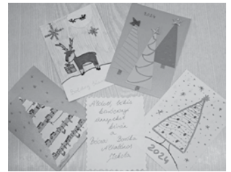
A gyerekek saját kezűleg készített karácsonyi képeslapjai

Nagyon szoros volt a verseny, 33 csapat vett részt a rendezvényen! Csupán pár pont különbség volt a dobogós helyezettek közt. Ezt a hatalmas aktivitást egy nagy társasjáték csomaggal díjazta a fenntartó Kiskőrösi Tankerületi Központ. Köszönjük!