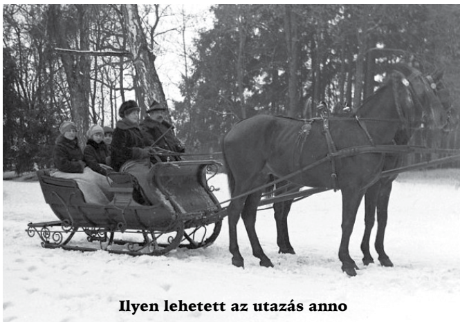
Ilyen lehetett az utazás anno