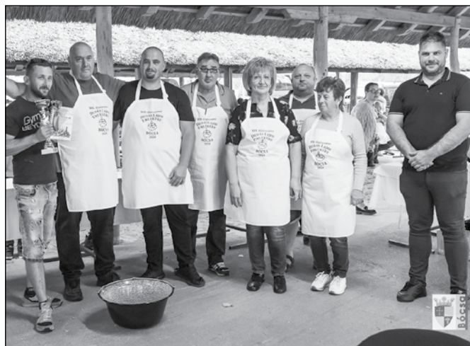
Az zsűri és a polgármester az első helyezettel