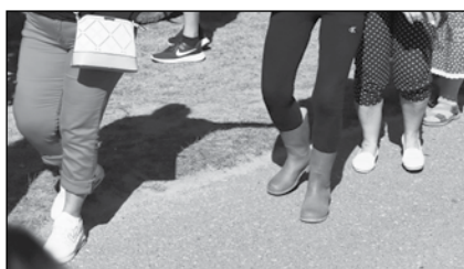
Melyik lábbeli a kakuktktojás?