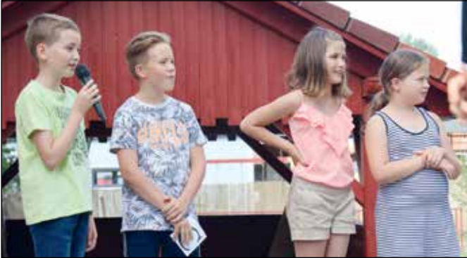
foto). Jutalmuk könyv és cirkuszjegy volt. A legjobb átlaga — 4,7 — a 3. és a 4. osztálynak lett. Az igazgatónő úgy jellemezte a tanévet, mint amit csak egy 320 oldalas beszéddel lehetne igazán méltatni... Ezért inkább csupán néhány gondolatot osztott meg a színházlátogatásokról, sporteseményekről és

Szóval 141 tanuló kapott bizonyítványt a Boróka Iskolában, közülük 31-en kitűnő eredménnyel (ld. címlap-