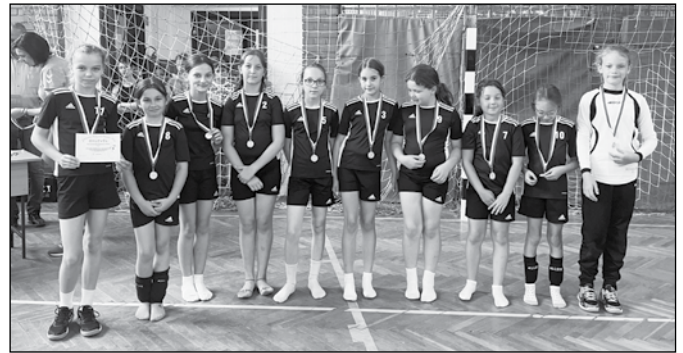
A képek Jakabszálláson készültek 2024 június elején a 11 évesek és a 13 évesek csapatával

A 10-11 éveseknél még nincs eredménykövetés hivatalosan. Viszont a gyerekek számolgatják és szép eredményeket értek el. Jakabszálláson voltunk Tavasz Kupán és ott a 10-11 évesek 1., a 12-13 évesek 2. helyezést értek el.