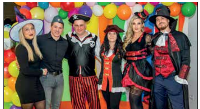
Az est vendége Lőrincz Tamás (a képen balról a 2.) olimpiai bajnok, világbajnok és négyszeres Európa-bajnok birkózó volt.