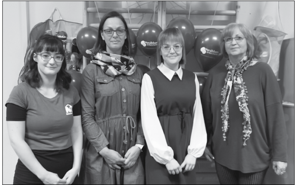
A munkatársak a megnyitó ünnepségen