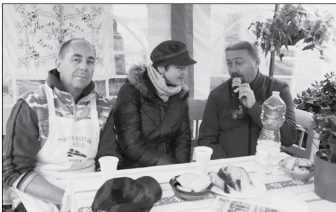
Interjú a torockói polgármesterrel