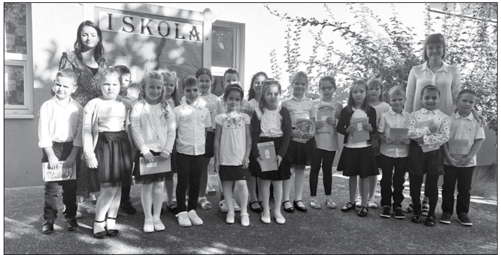
Elsőseink az évnyitón

Őszre kész lesz a tető és megújult állapotában hordozza majd a napelemeket. Mindez a rezsicsökkentés jegyében