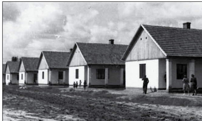
ONCSA-házak valahol Magyarországon a XX. sz. közepén

párhuzamosan folyt. Szomorú helyzet, hogy a zsidótörvények miatt mód nyílt egy uradalom kisajátítására Sződ községben (Göd mellett). Ez volt az ottani Schöffner család