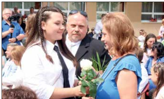
A szülők köszöntésének egy pillanata

reggel elindultatok és délután visszatértetek. Ez pedig a családotok és az otthonotok!”