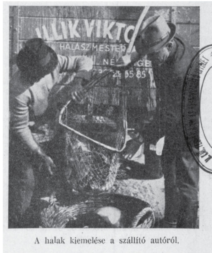
A halak kiemelése a szállító autóról.

halasi vizek Prónayfalván (ma: Tázlár – K. L.) keresztül ránkzúdultak. A 23.000 holdas határból, mintegy 10.000 hold egy nagy mélyedésben fekszik. Ennek nagy részén még az őszszel vetettek a gazdák. Aztán