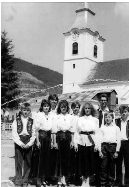
A háttérben a torockói unitárius templom

Évente rendszeresen fellépnek falunapokon, fesztiválokon. Nyaranta rendszeresen részt vesznek citeratáborban, ami a tanulás fő színhelye. Repertoárjukban a Kárpát-medence több tájegységének népdalai szerepelnek. A közelmúltban Kaskantyún és Ősiben léptek fel.