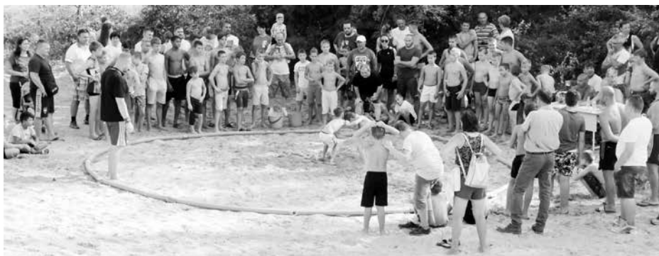
Grundbirkózás bemutató a Parkerdőben Falunapkor

A kistelepülések sportolói az általános iskolai évek elteltével gyakran kiszakadnak saját környezetükből, így a helyi sportegyesületből is. Erre találtak országos megoldást a Kozma István Birkózó Akadémia megalapításával. A csepeli intézmény szervezésében minden vidéki, ott lakó birkózó fiatal iskolába jár, emellett biztosítva van a rendszeres