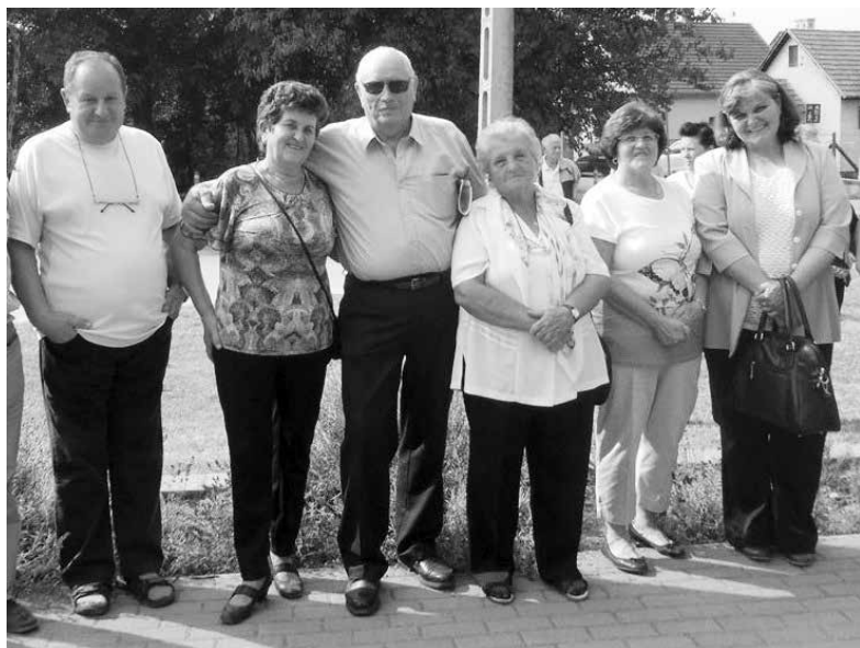
Bócsaiak és göd-bócsaiak találkozása

„A lelkes eljár ősei sírlakához, S gyűjt régi fénynél új szöveteket!” /Garay János/