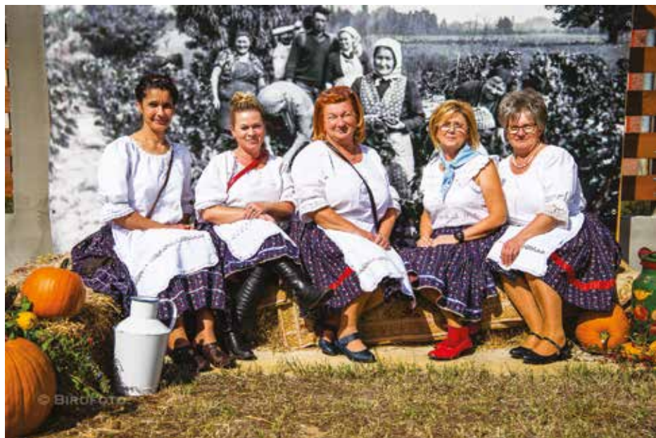
A címlapon a kisbócsai római katolikus templom látható. A színes felvételek Bócsa jeles rendezvényein, társadalmi eseményein készültek.