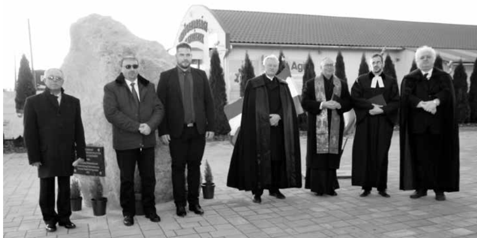
Emlékköavatás 2021-ben Bócsa központjában

Az egyesület fő tevékenysége Bócsa és az erdélyi Torockó testvértelepülési kapcsolatának ápolása. Támogatják Torockó Község Önkormányzatát és a helyi intézményeket, szervezeteket. Részt vesznek a kulturális rendezvényeken Torockón és Bócsán egyaránt, csereüldötetést szerveznek és nagy súlyt fektetnek a személyes kapcsolatokra. Az egyesület tagdíjából, tagi támogatásokból és az SZJA 1 %-ból tartja fenn magát, illetve látja el önként vállalt feladatait.