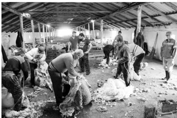
Birkanyírás egy bócsai hodályban