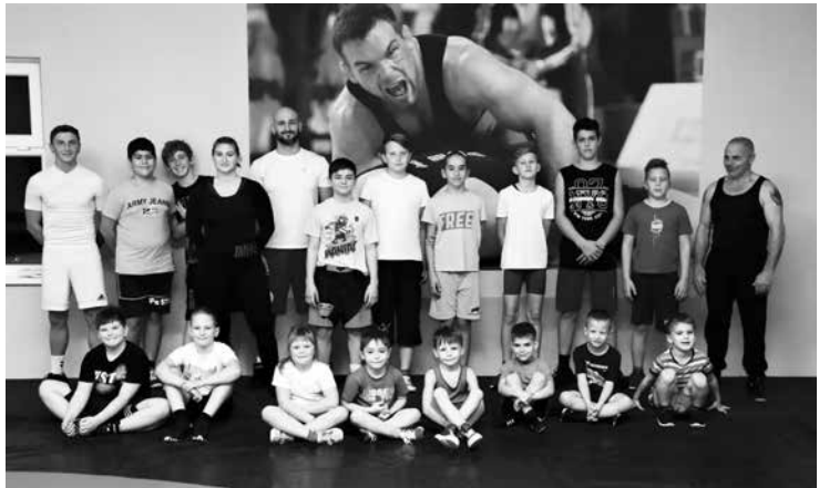
Csoportkép a legkisebbekkel