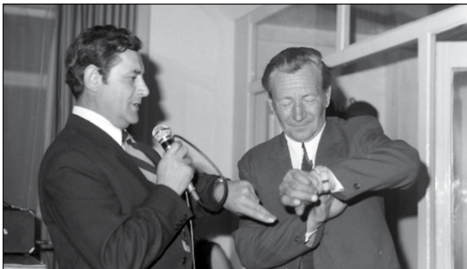
Vajon itt mi lehetett a feladat?