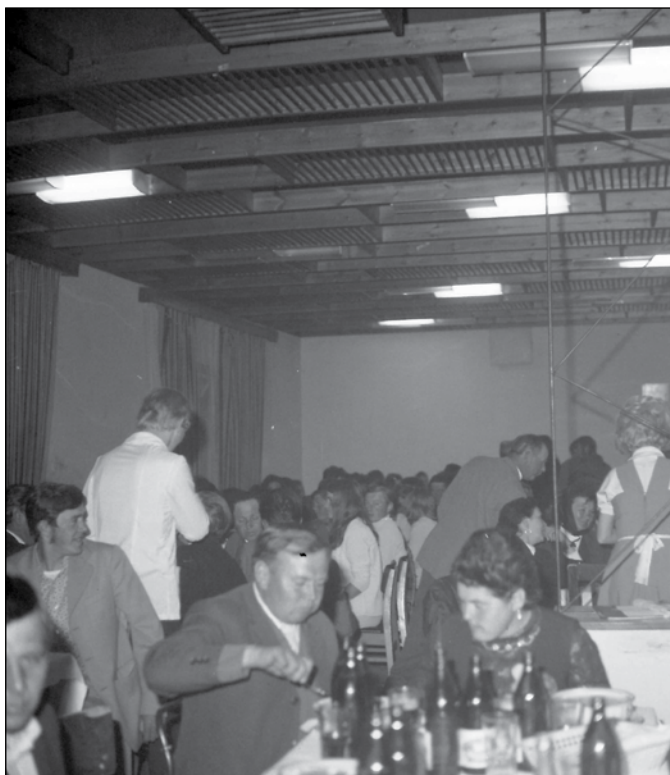
Figyelemre méltó a mennyezet akkor modern stílusú burkolata