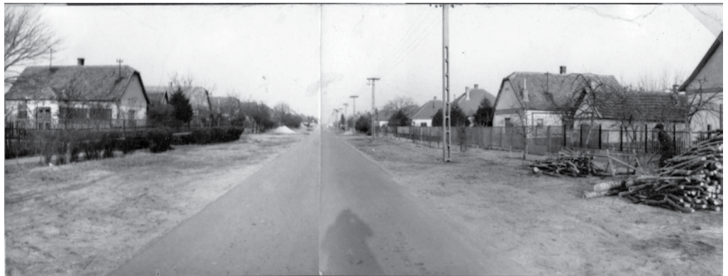
Bócsa az 1970-es években (Rákóczi utca)

Volt olyan, hogy az egyik orosz katona még magyarul is megszólalt: kiderült, hogy ungvári, kárpátaljai gyerek volt.