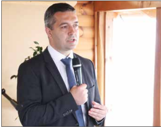
Dr. Feldman Zsolt államtitkár

„A bócsaiak ismét megadták a módját” — ezt már az egyik tapasztalt újságíró mondta, aki több rendezvényünkről is rendszeresen tudósít. Az ünnepélyes faültetés ugyanis szűk, de jeles körben történt meg. Május 6-án államtitkár és megyei önkormányzati képviselő tisztelte meg községünket. A fák ültetése ezen a napon újságírók és tévéstábok jelenlétében a Mózes-kosár Evangélikus