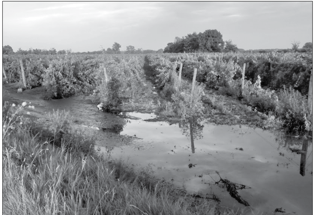
Útmenti szőlő a vihar után 2020 augusztusában

A szerkezetátalakítási támogatás keretében folyik ilyen