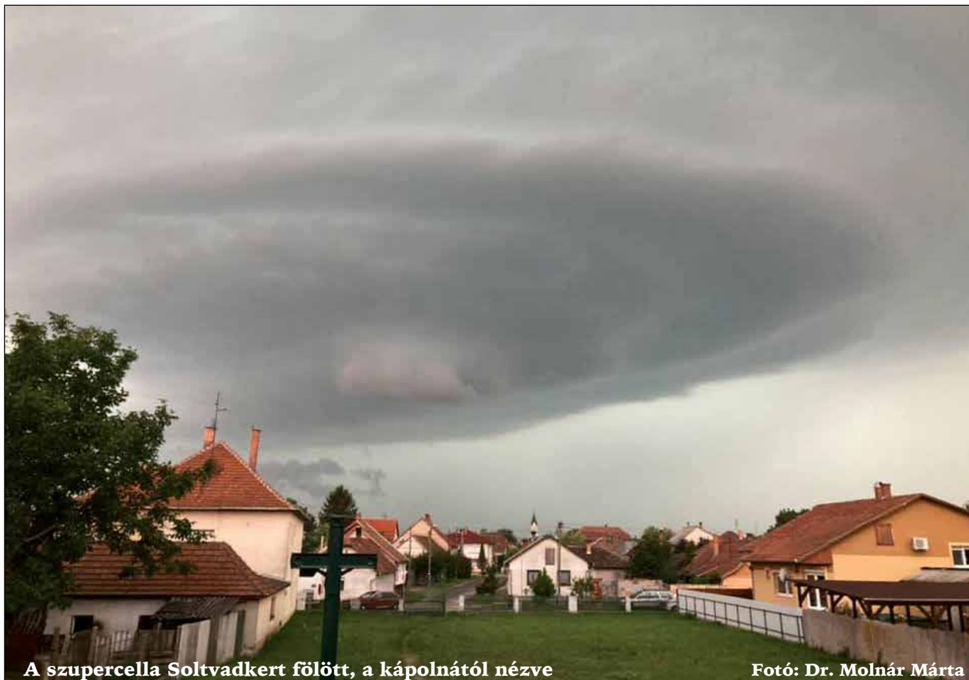
A szupercella Soltvadkert fölött, a kápolnától nézve