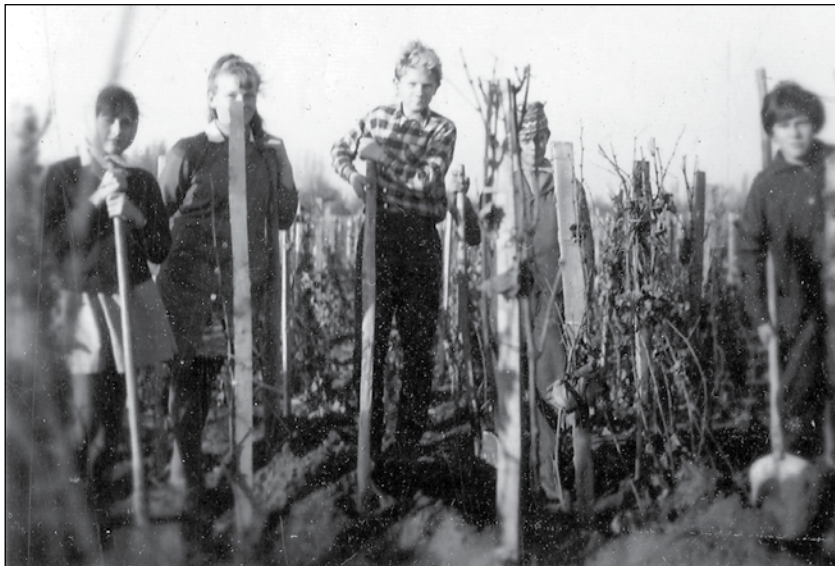
Társadalmi munka a bócsai szőlőkben (1960-as évek)