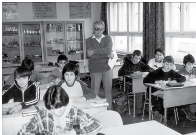
Tanítás a központi iskolában a 90-es években