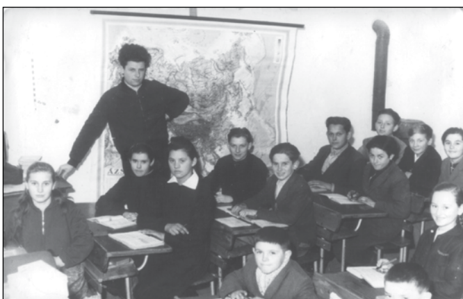
Az első állomáshely: Zöldhalom, 1963 körül

Más életformába és más környezetbe kerültek, ami előfeltétele volt a modernebb