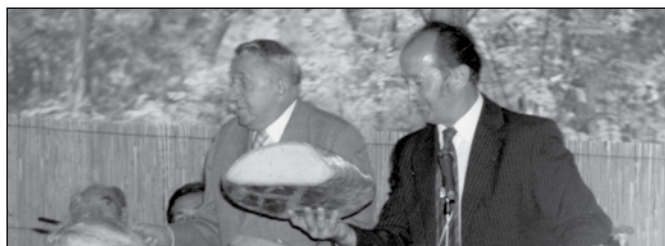
Az ünnepi kenyér megszegése

eljöttek még néhányszor disznóvágásra, baráti látogatásra. Kellott is a kapcsolat. Így hoztak össze az óbudai téglagyár igazgatójával, lett tehát elég téglá a bócsai építkezésekhez,