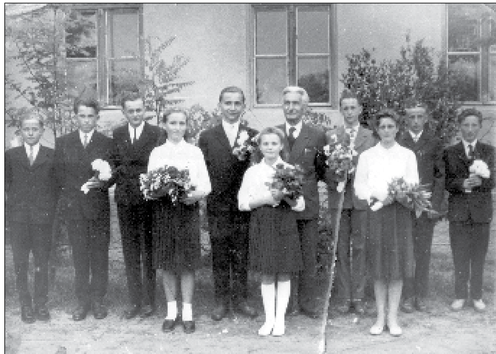
A nyolcadikosok 1962-ben.

A fentieket csak azért írtam le, hogy szülőknek nem lehetett könnyű élete. A papa papucskészítő volt és 1918-ban halt meg. Ezért tartom csodálatra méltónak, hogy apukám tanítóképzőt végezhetett.