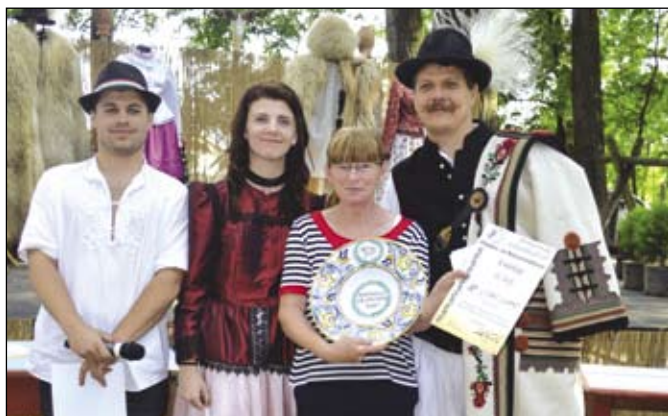
A Vidám Csapat átveszi a díjat