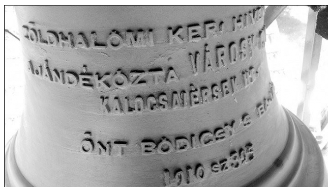
A zöldhalmi harang felirata az 1910-es évszámmal

A szertartás után mindenki ott maradt a fák alatt megerített asztaloknál egy kis süteményre és üdítőre. Itt beszélgettem el a renoválás szervezőivel, akik elmondták: a harang leszere-lése váratlanul érte őket, de egyben tettekre is sarkalta a közösséget. Renoválták a tetőt, újra festették az épületet és a haranglábat, maga a harang csapágyazását pedig kicserélték.