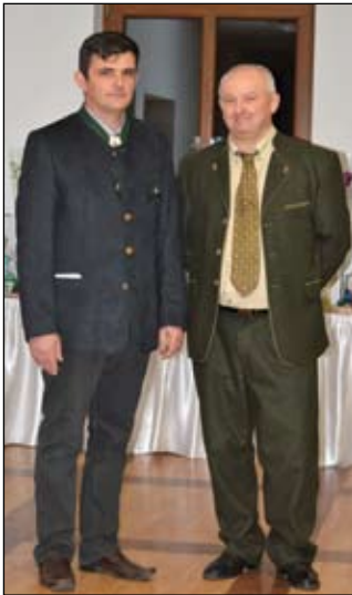
A bócsai Hubertus Vadász-társaság az elmúlt évekhez

hasonlóan az idén is megrendezte január első hétvégéjén a már hagyományos vadászok bálját. Az eseményre több mint 170 vendég érkezett, számukra jó alkalom volt ez baráti találkozóra és szakmai eszmecsere egyaránt.